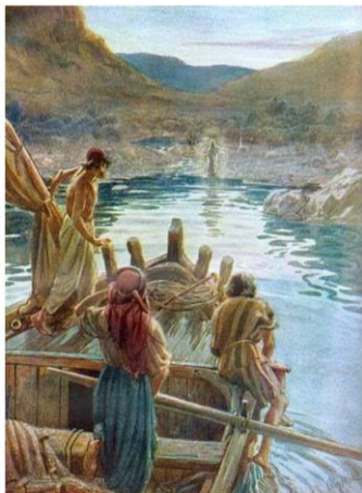
William Hole, Zjevení u Tiberiádského moře (Jan 21)

Tu onen učedník, kterého Ježíš miloval, řekl Petrovi: „Pán je to!“ Jakmile Šimon Petr uslyšel, že je to Pán, přehodil přes sebe svrchní šaty – byl totiž oblečen jen nalahko – a skočil do moře. (Jan 21,7)